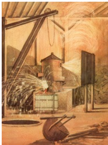
GÖRAN FREDRIK GÖRANSSON, avveckling av regler för järnindustrin