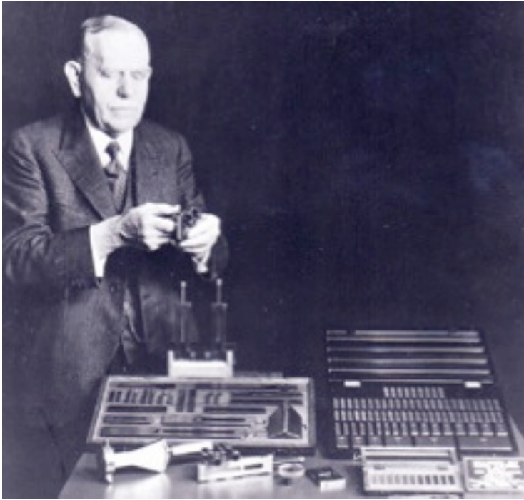
CARL EDVARD JOHANSSON, CE Johansson