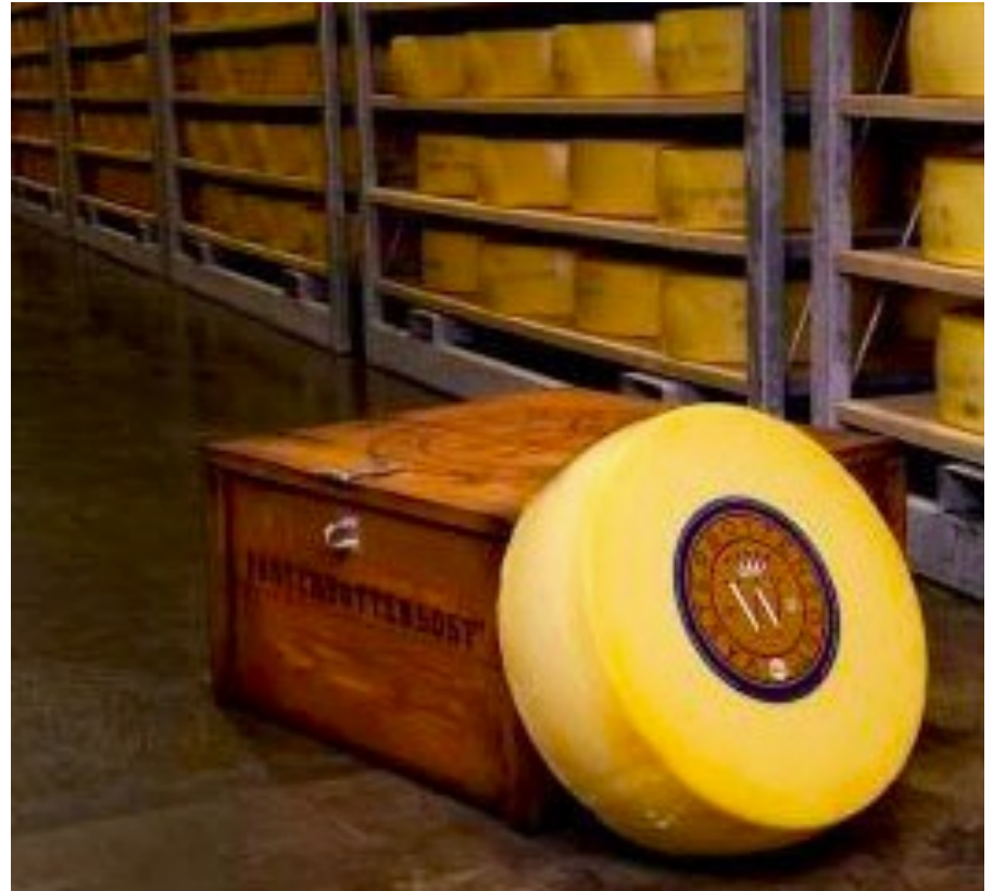
ULRIKA ELEONORA LINDSTRÖM, Västerbottenost