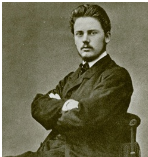
GUSTAF DE LAVAL, ångturbinen