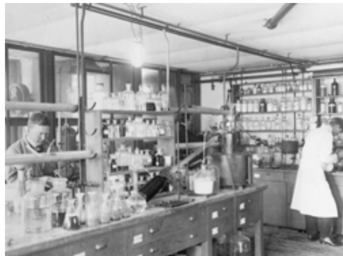
BÖRJE GABRIELSSON, avreglering av monopol