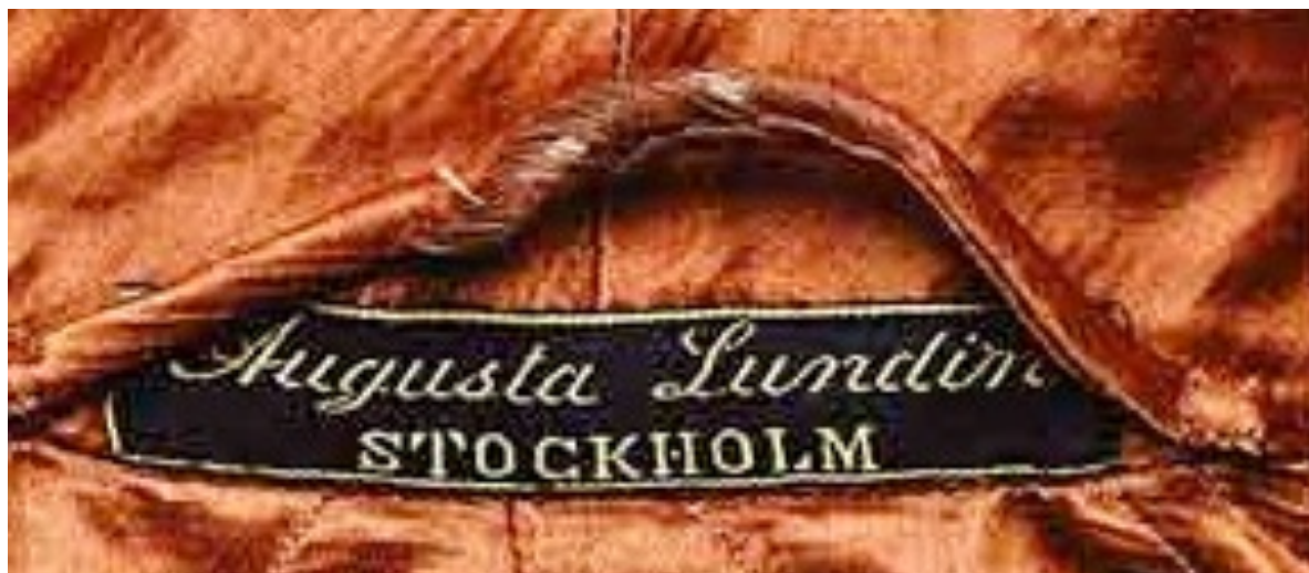
AUGUSTA LUNDIN, näringsfrihet för kvinnor