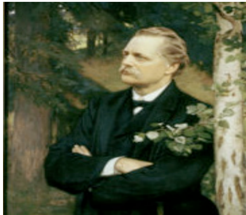
ARTUR HAZELIUS, Nordiska museet och Skansen