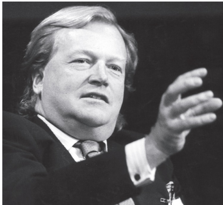
JAN STENBECK, Comviq, Radio Rix, TV3 etc