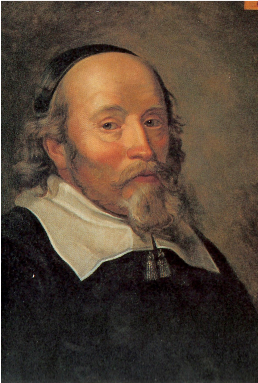
LOUIS DE GEER, Holland